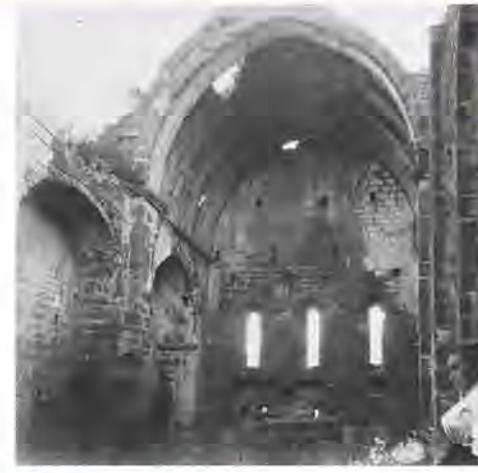
L'absis de Sant Genís abans de la seva destrucció el 1928, en una fotografia de Josep Salvany, de 1915.

És interessant observar la presència d'una cornisa simple, formada per un rengle de lloses una mica sobresortides del parament sud de l'església, i la seqüència de forats d'encaix de bigues, que s'estenen des de quasi la capçalera fins a poc més de la meitat de la seva llargària. Tot plegat ens dibuixa la presència d'un espai semicobert, a manera de claustre. Lloc idoni precisament per acollir els enterraments destacats, segurament dels membres de la família dels Castellvell, entre els quals caldria comptar els fundadors del monestir.